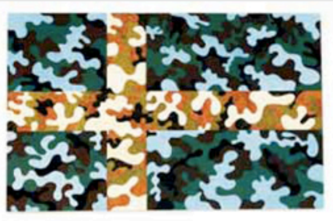
Nytt verdensbilde: Senter for Samtidskunst viser utstillingen «Geografi». De to kunstnerne kartlegger verden på sin egen måte.

07200 HEIDI BOLSTAD kultur@adresseavisen.no